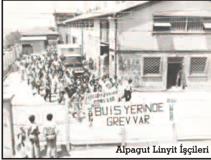
Alpagut Linyit İşçileri

1969 yılında işçilerin çalışma koşullarının çok kötü duruma gelmesi sonucu Alpagut Maden İşçileri Sendikası işletmenin Türkiye Kömür İşletmeleri’ne(TKİ) devredilmesi için Enerji ve Tabii Kaynaklar Bakanlığı’na başvurular. Ama olumlu yanıt alamadılar. 1969 Haziran’ında işletmenin durumu çok kötüydü. İşçilerin maaşı 3 aydır ödenmiyor, teknik kadrolar işletmeye uğramıyordu. Bunun sonucunda 13 Haziran 1969 yılında 786 işçi işletmeye el koydu.