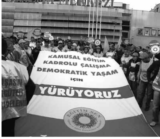
Eski Adliye önünde toplanan Eğitim-Sen'liler burada basın açıklaması yaparak

Devlet Tiyatrosu önünden eski adliye önüne kadar yürüyüş yapan eğitim emekçileri yer yer trafiği kapatarak yürüdü. Yürüyüş sırasında ara ara ajitasyon konuşmaları yaptılar.