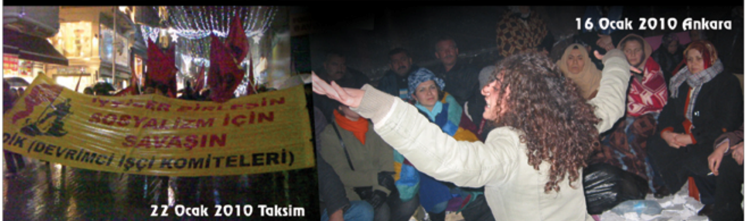
22 Ocak 2010 Taksim