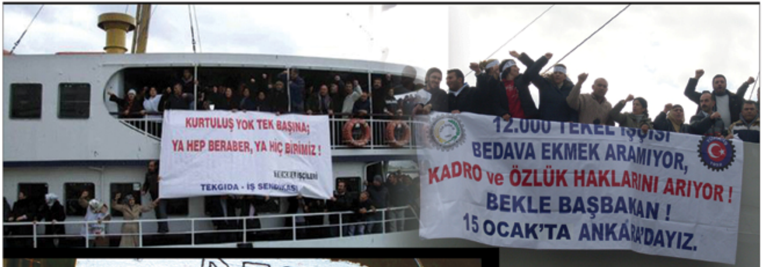
13 Ocak 2010 İzmir Vapur İşgali