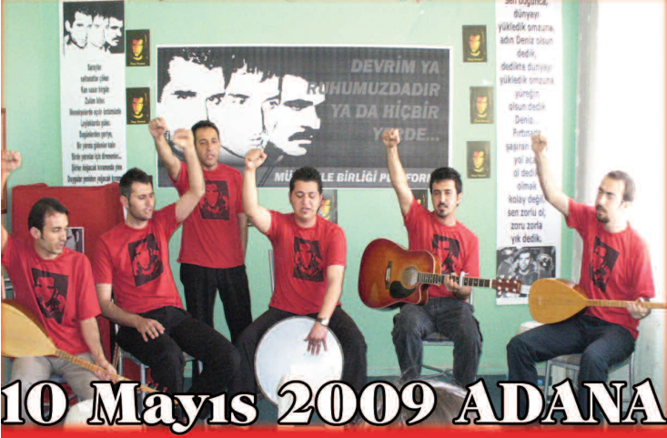
10 Mayıs 2009 ADANA