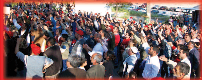
MERSİN AKANSEL İŞÇİLERİ