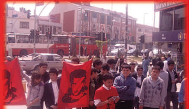
6 Mayıs 2009 SARIGAZI