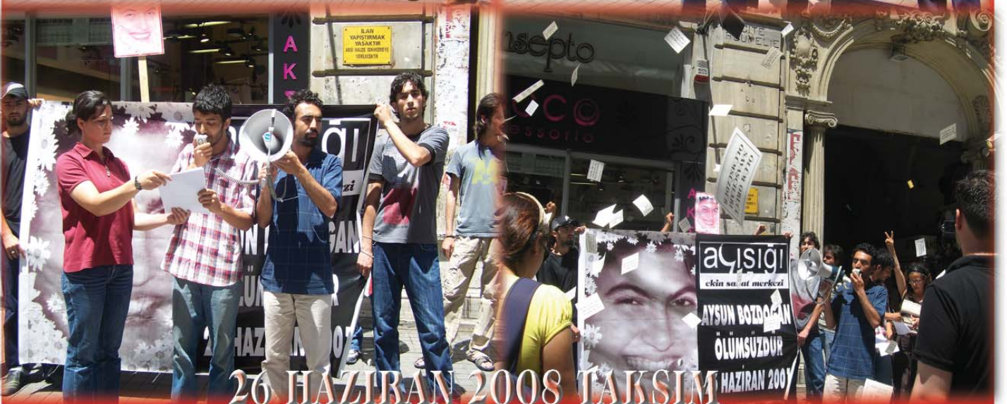
26 HAZİRAN 2008 TAKSİM