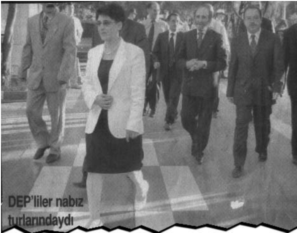
DEP'liler nabız turlarındaydı

TİSK Başkanı olarak, görevi tüm çalışanları açlık sınırında yaşatmak olan bu adamın, pişkin bir suratla "asgari ücretli evladından kesilen vergiler" ifadesiyle, düşmanlığına emekçileri ortak etmek nüansı dışında, bu sözleri hemen hergün ırkçı-şoven çevrelerden duymaya alışmıştık. Bu kez, alışılmamış durum şuydu. DEP'li vekiller, "demokratik anlayışına itibar ederek" geldikleri TİSK Başkanı Refik Baydur'un bu sözlerini, sessizce dinlediler. Sözler, bu ziyaret sırasında sarf edildi, tüm gazeteler yazdı, gündem yazmadı. Aynı günlerde Kürt halkı,