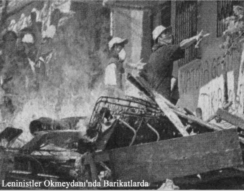
Leninistler Okmeydanı'nda Barikatlarda

bir derede kalıyor? Reformistlerden devrimcilere yol arkadaşı olduğu nerede görülmüş. Onlar devrime sırtlarını döneli çok uzun zaman olmadı mı? Bunun da ötesine geçip onların yer yer devrimin karşısına geçtiklerini, burjuvaziyle aynı dili kullanıp devrime ve devrimcilere saldırdıklarını bilmeyen mi kaldı. Örneğin EMEP çevresinin en son Çapa'da bir yanlışlık sonucu patlayan bombayı nasıl hemen devrimcilere bir saldırı gerekçesi haline getirdiğini görmedik mi? Reformizmin devrimin ayaklarına vurulmaya çalışılan bir pranga olduğunu anlamak için daha kaç NATO zirvesi geçirmemiz gerekecek? Ekmek ve Adalet, “Reformizmle her uzlaşma, reformizmden her etkilenme de devrimi zayıflatır” diyor. O halde daha niye hala reformistler arasında “iyi reformist-kötü reformist” seçimi yapmaya çalışıyorsunuz. Madem Okmeydanı'ndaki devrimciler arasındaki güç ve eylem birliğine atıfta bulunarak “Okmeydanı'ndaki direniş, birlikte direnilebileceğini, birlikte çatışabileceğini dosta düşmana göstermiştir” diyorsunuz, o halde hala bu birlikteliğin içine reformistlerin tümünü olmasa da bir kısmını çağırıyorsunuz. “EMEP artık safını belirlemelidir” derken yaptığımız tam da bu değil mi? Ya da hala ısrarla süreçte temel belirleyenin NATO Karşısı Birlik olduğunu söylemeniz de aynı anlama gelmiyor mu? Oysa herkes biliyor ki, bu süreçte başından sonuna belirleyici olan Okmeydanı'nda kendi içinde toplanan devrimci yapılar. NATO Karşısı Birlik'in içinde bulunan reformist çevreler burada yoktular.