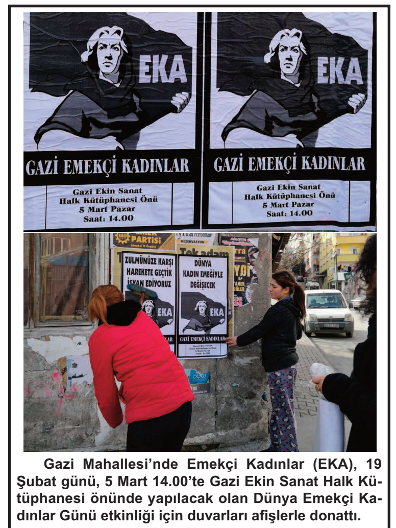
Gazi Mahallesi'nde Emekçi Kadınlar (EKA), 19 Şubat günü, 5 Mart 14.00'te Gazi Ekin Sanat Halk Kütüphanesi önünde yapılacak olan Dünya Emekçi Kadınlar Günü etkinliği için duvarları afişlerle donattı.

Böylece nasıl bir sandık kurulduğu da bir kere daha anlaşılabilir oldu. Kelimenin gerçek anlamında bir terör eşliğinde "evet"e yelken açan dinci-faşizm, başka bir sonuca "resmi" anlamda izin veremeyeceğini, es kaza çıkarsa da tanımayacağını herkese ilan etmiş oldu.