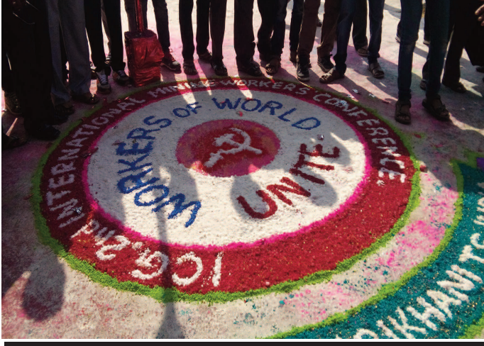
Dünyanın Bütün İşçileri Birleşin

M aden işçileri denince belki de akla işçi sınıfının en yoksul, sosyal, ekonomik durumu en kötü olan, yaşam standartları en düşük olan kesimi gelir. Fakat işçi sınıfının tarihsel olarak geçmişten günümüze sermaye sınıfına ve sömürüye karşı verdiği o amansız ve sert savaşta madencilerin payı büyüktür. Kapitalizmin kar hırsı devam ettikçe işçilerin durumu daha da kötüleşiyor, madenciler yerin yüzlerce metre altında ölümle baş başa ailelerini bir daha görmemek, güneşi bir kez daha görememek kaygısıyla her gün yer altına iniyor. Dünyanın bir köşesinden diğerine Latinlerden, Asya'ya, Avrupa'dan Afrika'ya kadar nereye giderssek gidelim madenlerin olduğu yerde farklı sektörlerdeki maden işçileri aklıyla terbiye edilmeye, yoksullukla yaşamaya mahkum bırakılıyor. Fakat maden işçileri artık buna bir dur demek için örgütlülüklerini ulusal ve yerel çaplardan daha üst bir düzeye uluslararası düzeye taşımış durumda. 2012 yılında Uluslararası Madenciler Konferansı'nın birincisi Peru'da düzenlendi. Bu sene Şubat'ın başında ise Uluslararası Madenciler Konferansı'nın ikincisi Hindistan'ın Hydrabad kentinin Ramagundam ilçesinde düzenlendi.