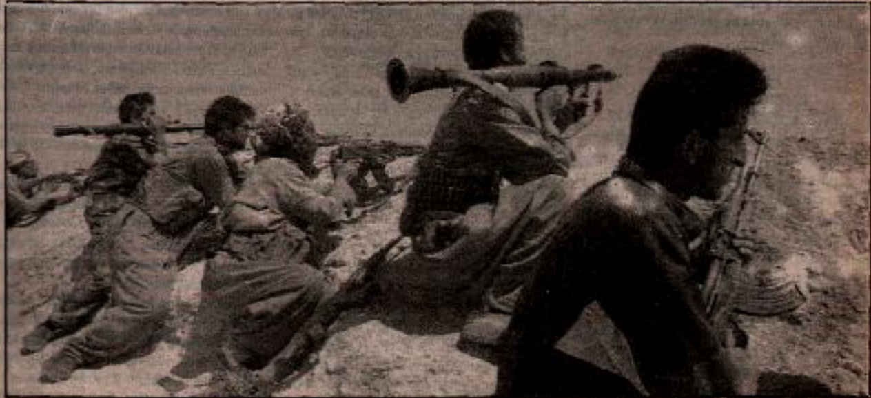
TC çıkar gördüğü her bölgeye uzanıyor, buna Güney Kürdistan da dahil.

Aksine proletaryaya, emekçi halk ve nüfus-sümsal kurtuluş için amansız bir savaşa tutuşan Kürt halkı, her kıyamı bağandıktan sonra sanki sırf düşmana topraklarına fırsat ver-