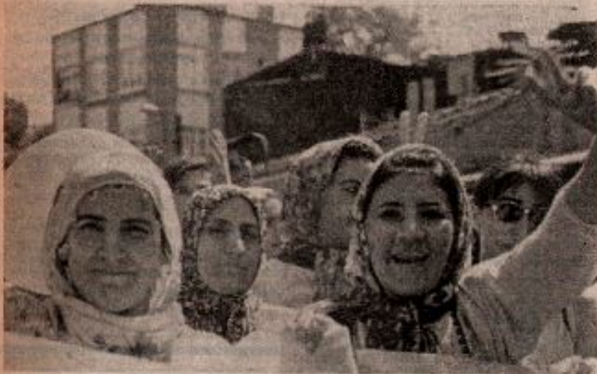
Kürt Halkı ezilmişliğe ve esarete karşı on yıllardır mücadelesini sürdürüyor.