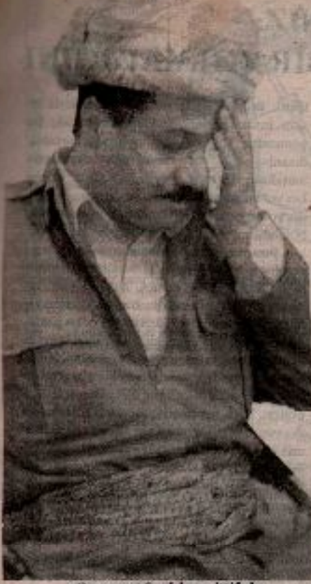
Barzani Sadılam ittifakı Kürt ulusu üzerindeki ulusal baskıyı kaldırmayacaktır.

mak. İlk yapılan Talabannıy: etkisiz hale getirmek oldu. Şera Barzani'del Beki Barzani'yi etkisiz hale getirme planı zaman alacaktır, ancak Irak için kesin olan bir şey var ki, o da, Arapların Kürtler üzerindeki ulusal baskı politikası yarıdan ve eskiden daha koyu biçimde uygulanacaktır.