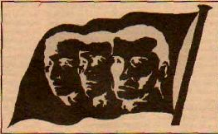
Adları Onurumuz, Kavgaları Adımızdır.

Bu topraklarda devrimci kavgaya her zaman yürek ve cüretten oluşmuştur. Bu yüzden, savaşın devrimci güçler için en erdiler değeri, düşen savaşçıların anlardır. Proletarya sonsuzluğa uğurladığı nice savaşın mücadele dolu yaşamından en çok öğrenen ve geleceğin büyük kavgalarına bu cüret ve yüreği en iyi taşıyan sınıftır. Çünkü o geçmişin bir toplama ve geleceğin şimdi de yaşayan görüntüsüdür. Dünyü bugünde yaşatan, bu günd-