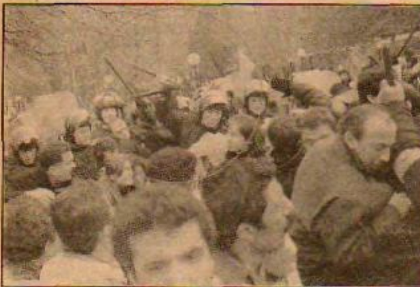
Ankara'da beklenen oldu. Yine devlet terörü...

YASASIN DEVRİMCİ KAMU EMEKÇİLERİNİN MÜCADELE BİRLİĞİ! Emekçi Kamu Çalışanları