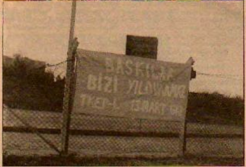
13 Mart GKK'ında eylemleri bir alanda yaygınlaştırıyor.

çıların, bu günümüze ışık tutan yaşantıyla, günümüz mücadelelerinde de etkin kaynağı olarak görüyoruz. Bu nedenle 13 Mart Savaşçalarını anmak, toplantı ve anımlar düzenlemenin ötesinde bir anlam taşımaktadır. Onları anlatmak, TKEP/LENİNİST'ı anlatmaktır. Çünkü leninist kadrolar reformist kambarlarını atmak zorunluluğuyla karşı karşıya kaldıklarında, savaşa ve tınına gücünü en çok 13 Mart'ın kızıl güllerinin anılarından aldılar. Onların mirasında illegal örgütlenme vardı, silahlı mücadele vardı ve devrimin zaferi için politik zor araçlarını geliştirmek, silahlanmak ve hazırlanmak zorunluluğu vardı.