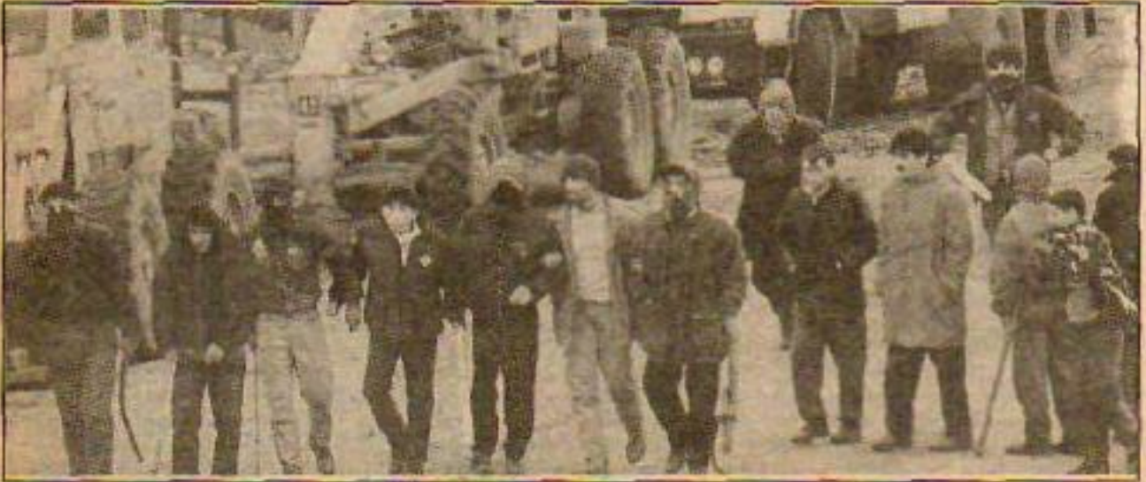
Devrim se zafer, yüreklilik ve pratik demektir.

Devrimci durumdaki en iyi biçimde yararlanarak, kitleleri ayaklandırmak, iktidarı ele geçirmek için komünist öncünün, çabı, girişken ve pratik davranması gerekiyor. Gelişme, büyüme ve güçlenme politikası olmayan her toplum, hareket ve örgüt zamanla yıkılıp gider. Devrim dönemlerinde