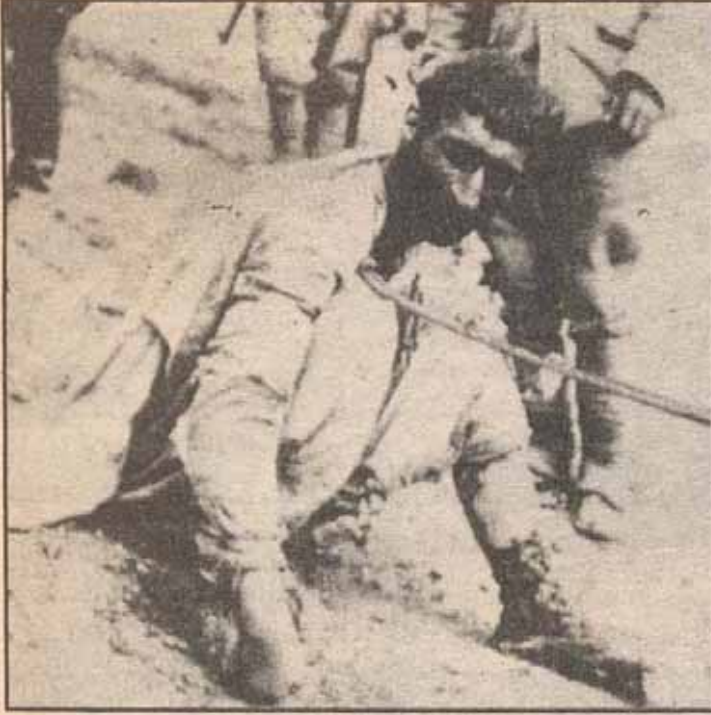
Dersim sürgünlerinden biri sürgüne gidiyor

farklıdır. Bundan dolayı ulusal sorunun çözümü ve yaratacağı sonuçlarda farklı olacaktır.