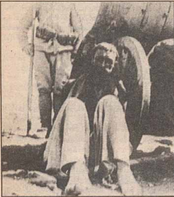
Oy Dersim, Dersim.