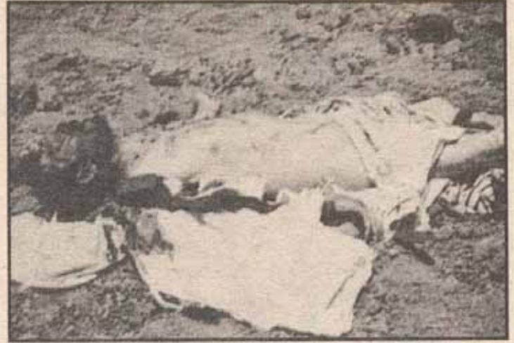
Dersim katliamı ya da bugünkünden bir görüntü.

3-Osmanlı İmparatorluğunun çökmeye başlaması. Geçen yüzyılın başlarından itibaren Osmanlı İmparatorluğu dağılmaya karşı karşıya geldi. Gene aynı yüzyılın yarısından sonra Osmanlılar Afrika ve Ortadoğuda arka arkaya yenilgi aldılar. Ruslar da-