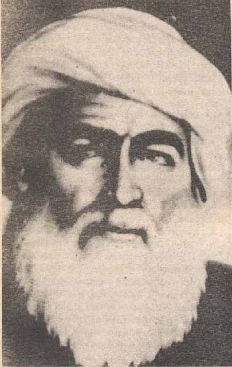
Tarihten bir Kürt lideri: Şeyh Sait

du. Türkiye solu içinde Kürt gerçeğini ilk gören ve kabul eden THKO olmuştur. Öyle ki THKO Türkiye devrimini bile başlatmak için Kürdistan'ı seçmiş ve kitlesel olarak esas olarak Kürt halkına dayanmıştır. Bu insanların idam sehpasında "Yaşasın Kürt ve Türk halklarının mücadelesi" demeleri iki halkın mücadele birliğini örmede de büyük bir kilometre taşı olmuştur.