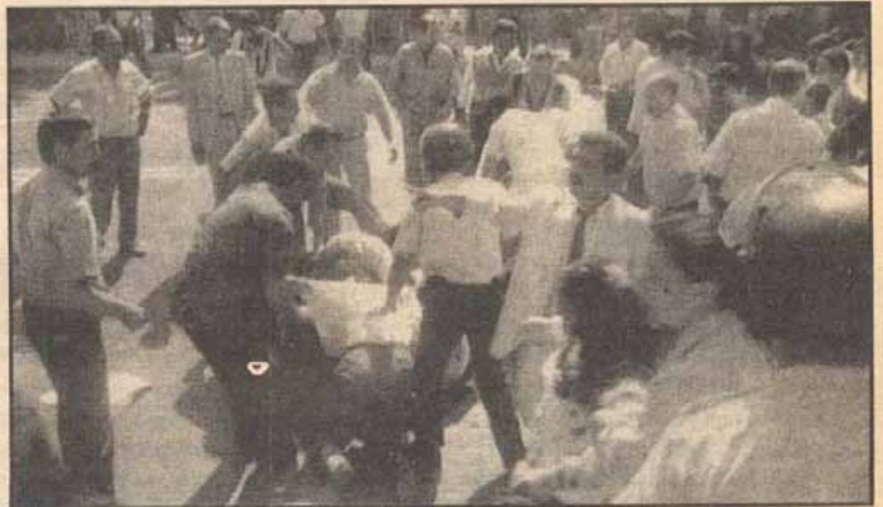
Cezaevlerindeki tutsakları destekleyen ailelere polis yine saldırdı

Bu saldırılar ülke gerçeklerinden ayrı ele alınamaz. Egemen güçlerin zor ve şiddet aygıtı olan devlet, ülkemiz halklarına karşı uyguladığı terör başta olmak