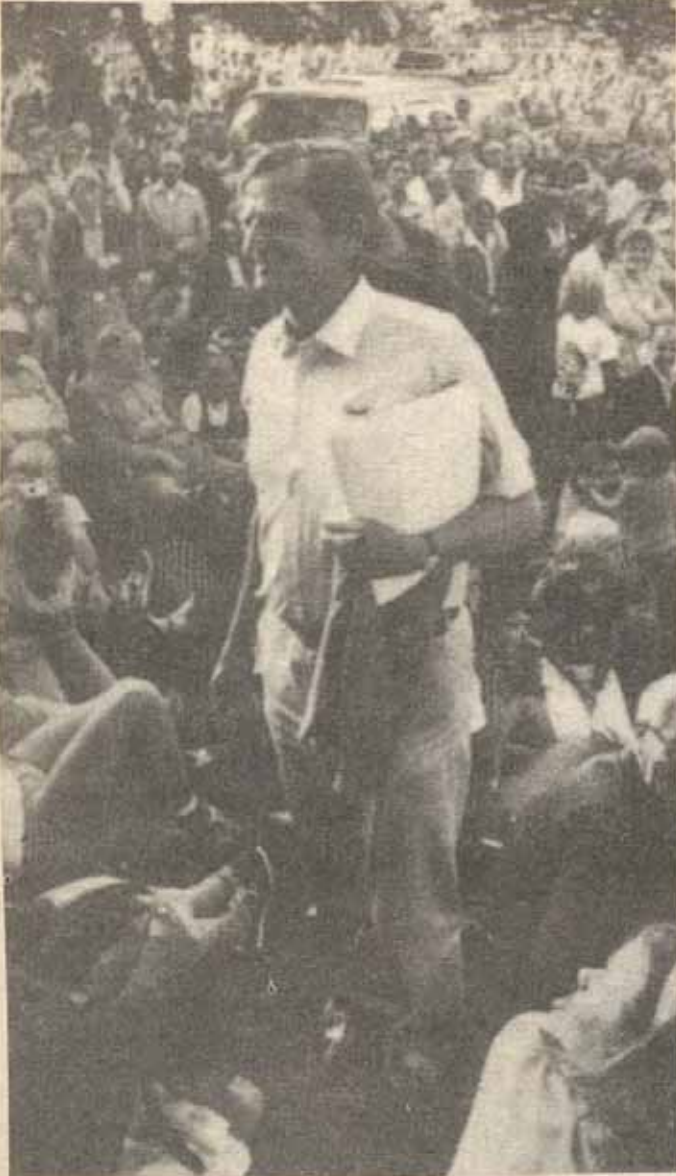
İsveç Sosyal Demokratlarının lideri Olaf Palme

Türkiye'de Ecevit ve partisi bu politikayı yıllardır savunuyorlar. Yakın tarihi ve Ecevit'in gelişmesini bilen herkes bilirki, bu adam ve partisi sermayeye sü-