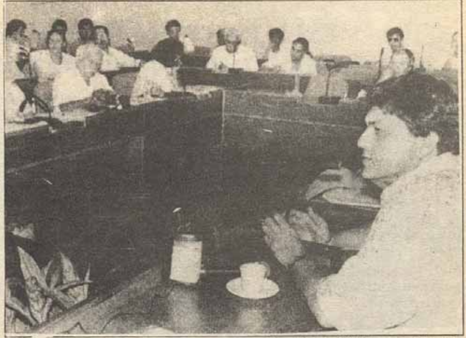
Başarafa 40. Sayfada.

ve Parti mülkiyetini kullanıp kullanmadığını denetlemekte görevli komisyonun raporuydu. Bu komisyon rahat çalışmadığını maddi sorunlarla karşılaştığını belirtti. Gerçektende sağın, FSLN'ye karşı anti-propaganda malzemelerinden birisi yolsuzluk iddiaları idi.