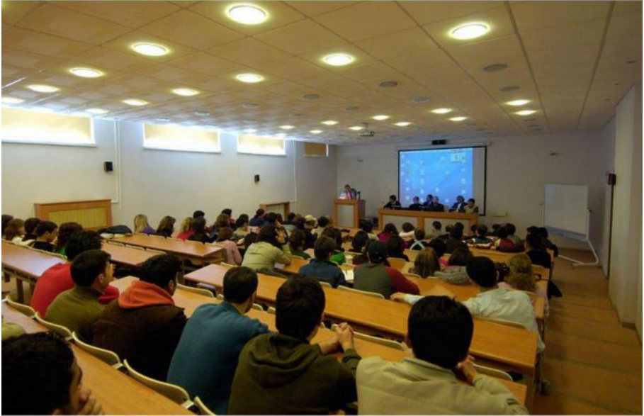
Antep'ten Bir DÖB'lü Öğrenci

Bu şekilde meslek liseli öğrencilerin ucuz iş gücü olarak güvensiz çalışma alanlarında kullanımı yükseköğretime bağlanacak. Burjuva medya ise haberi “Yükseköğretimde çeşitlenen öğrenci profiline uygun talepleri karşılayabilecek, sosyal ve ekonomik gelişime katkı sağlayabilecek, piyasaların çeşitlenen iş gücüne cevap verebilecek, istihdamı arttırabilecek, artan rekabete uyum sağlayabilecek bir üniversite hedef olacak” şeklinde aktardı. Bu da aslında “Bölgesel Mesleki Eğitim Üniversitesi” öngörülerinin neye benzeyeceğine dair ciddi bir kanıt niteliğinde. Sermayenin egemen olduğu kapitalist sistemde, eğitim nasıl öğrencinin isteği ve yeteneğine göre değil de, tam aksine tekelci sermayeye göre şekillenirken, akademiye yönelik bu kapsamlı saldırılar ve müdahaleler bizleri şaşırtmasa gerek. Eğitim sisteminin sermaye sınıfı için tek bir alanda uzmanlaşmış bir kuşak yaratılması, öğrencilerin yetenek, beceri ve ilgi alanlarını önemsemeden ucuz iş gücü olarak yetiştirilmesi bu “düzenlemelerle” giderek artacak. Bir meslek liseli gencin teknik bilgi gerektiren bir iş için, tıpkı bir fabrika işçisi gibi, genel kol gücü gerektiren işlerde çalıştırılmasının önü bu sayede tam olarak açılmış olacak.